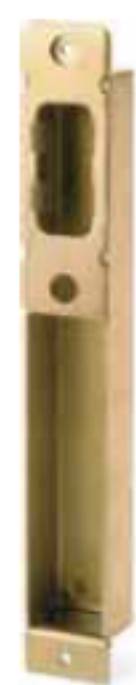
Cajetín V Antipalanca

Incorpora como novedad un sistema antipalanca que protege eficazmente del retroceso forzado de los bulones centrales de cierre mediante el Cajetín V.